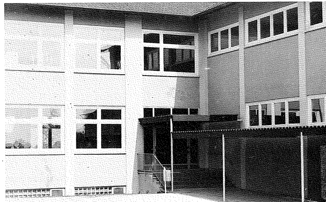
So sah die "neue Schule" 1964 aus!