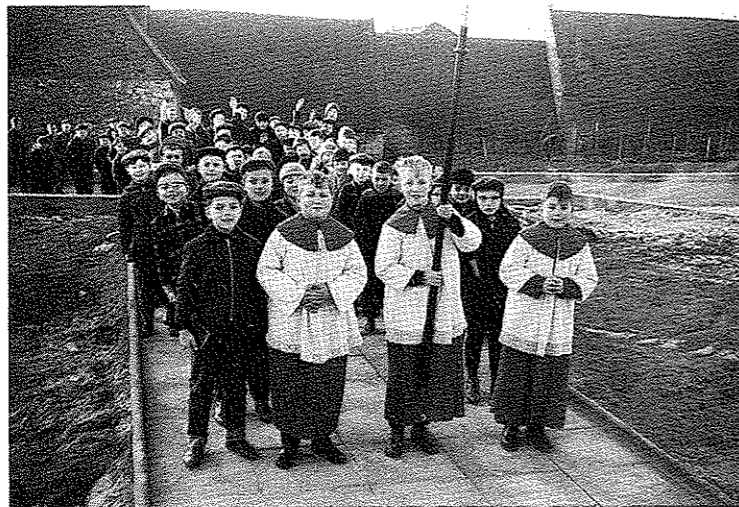
Die Spitze der Prozession vor dem Haupteingang der Schule.