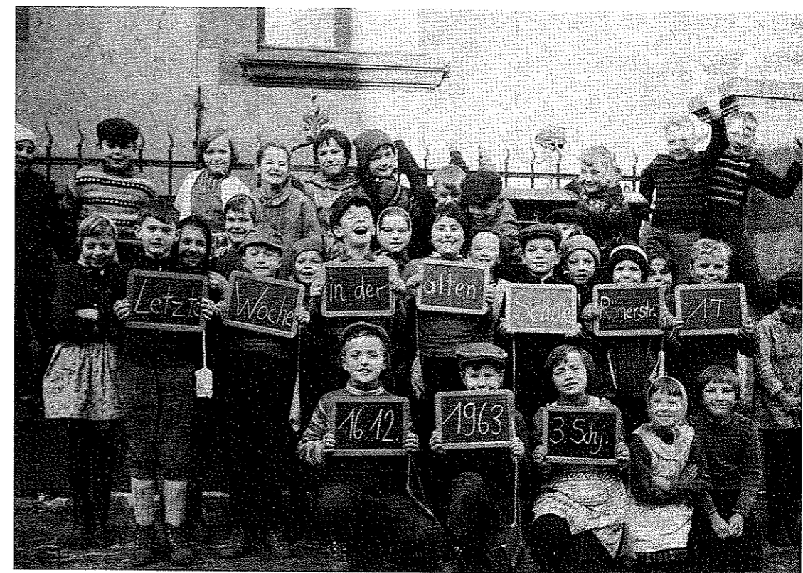
Vergebliche Hoffnung! Es war nicht die letzte Woche!

Die Einweihung der neuen Schule in der Feldgartenstraße wurde mehrmals verschoben. Als am 16.12.1963 dieses Foto von der "letzten Woche" in der alten Schule entstand, mußten die Kinder noch einige Wochen warten, ehe sie ihre neuen Klassenräume endlich beziehen konnten. Bis zum 7.2.1964! Die offizielle Einweihung fand schließlich am 8.4.1964 statt.