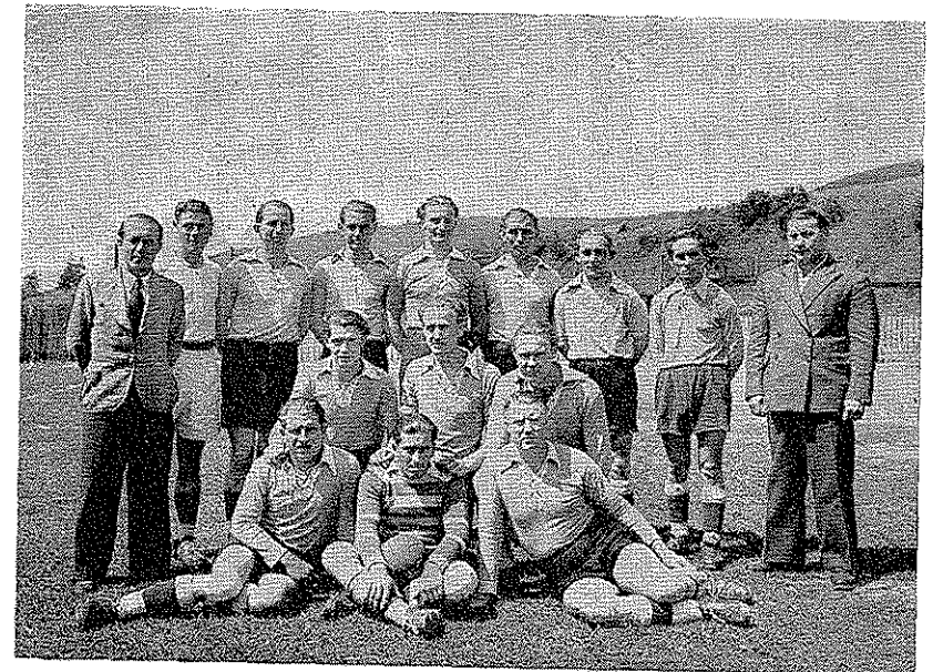
1. Mannschaft des TSV Mainz-Ebersheim 1947