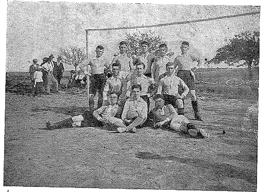
Mannschaft des DJK Ebersheim im Jahre 1925