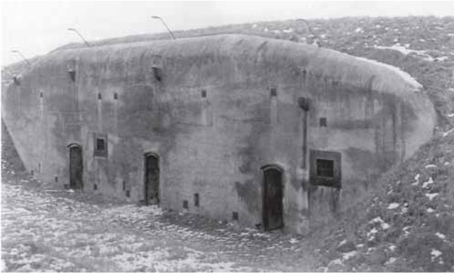
Munitionsbunker an der Ecke Nieder-Olmer Str/ Fort-Muhl/Peter-Hofmann-Str

maßnahmen mit dem Bau einer Ringstraße von Wackernheim bis zum Kesseltal zwischen Hechtsheim und Ebersheim. Ab 1909 wurde mit dem Bau einer Festungsbahn begonnen, deren drei Linien dem Heranschaffen der Baustoffe und dem Transport der Munition und Verpflegung dienten. Die betonierten Festungsbauten entstanden ab 1909. Ihr bedeutendstes Werk war das Fort Muhl in Ebersheim, das innerhalb von drei Jahren bis 1911 gebaut wurde.