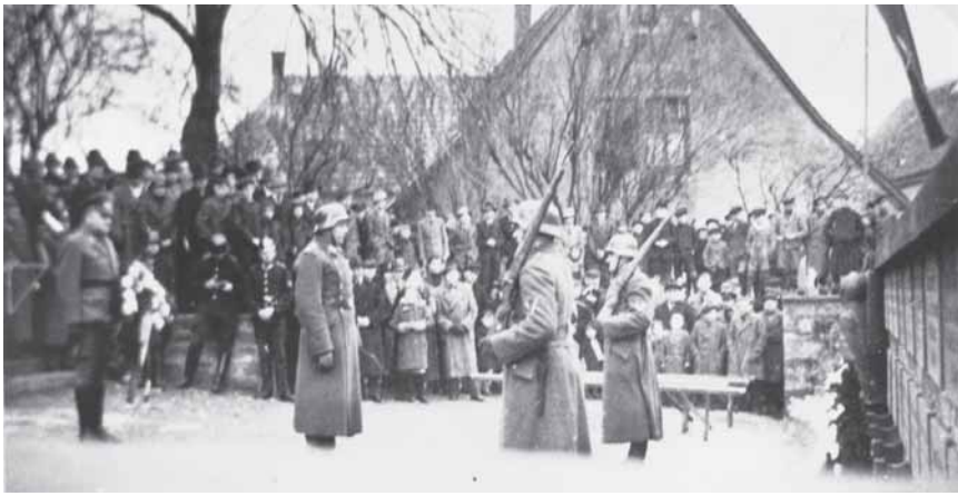
Ältestes bekanntes Bild des Ehrenmals mit Blick auf die Namenstafeln bei einem Heldengedenktag