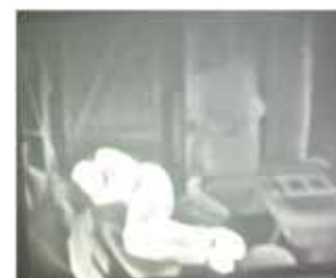
Mit Kamera ist sofort sichtbar, wo sich die Person im Raum befindet