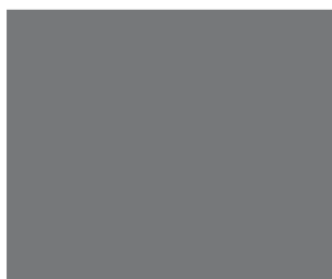
Ohne Kamera ist es unmöglich eine vermisste Person schnell zu finden