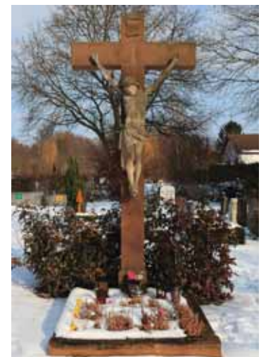
Das alte Kreuzifix

Für die Antworten müssen wir mindesten 100 Jahre zurück in die Ebersheimer Geschichte schauen. Zu dieser Zeit wurde die Kirche erweitert. Zum neuen äußeren Er-